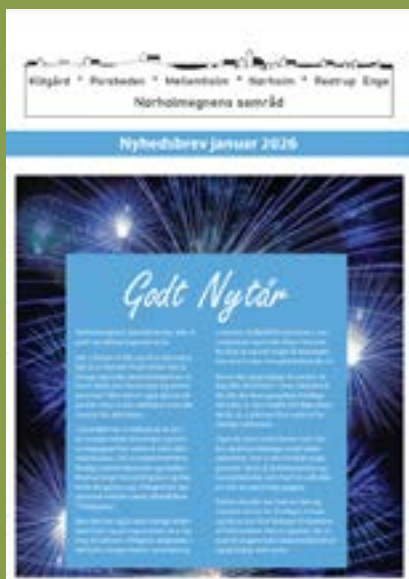
Tidligere udgivelser i 2026

I kan se hjemmesiden på www.borgernyt.dk