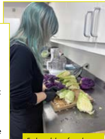
Forberedelse af maden

Med pilotprojektet har Nørholm Skole og Gården STU ønsket at afprøve, hvordan fælles skolemad kan fungere i praksis - både som samlingspunkt og som en naturlig del af hverdagen. For eleverne på Nørholm Skole handler det ikke kun om maden på tallerkenen, men også om fællesskab, samtaler og modet til at smage og prøve nye ting, mens STU-eleverne får selvtillid og glæde ved at se, at deres indsats har positiv effekt på andre.