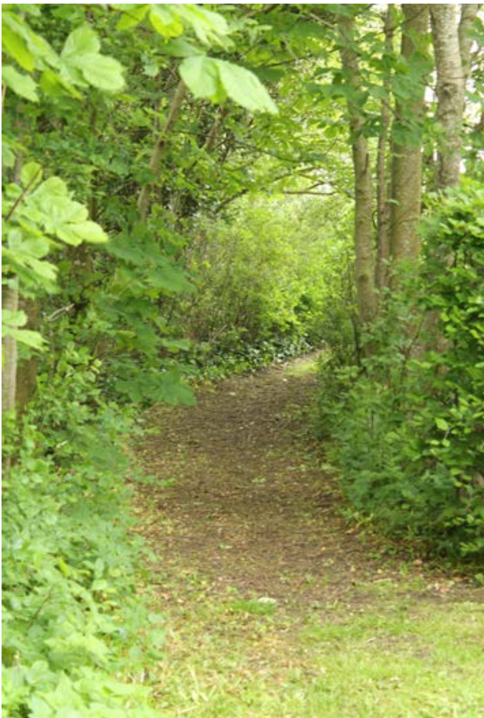
En smuk fælles gangsti klædt i grønt

I Borgerforeningen har vi derfor planer om at få fællesjorden og gangstierne tydeliggjort ved hjælp af et bykort. Vi vil efterfølgende gå i dialog med de beboere, som har en matrikel, der grænser op til fællesarealerne og gangstierne, for derigennem at få beskrevet, hvordan arealerne fremover kan beskyttes og vedligeholdes.