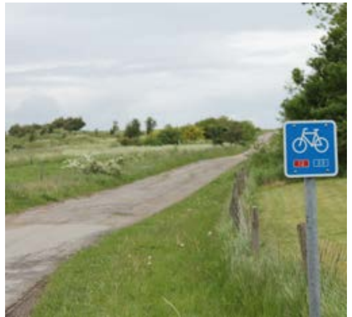
Flere og bedre vedligeholdte cykelstier langs fjorden mellem Aalborg og Nibe

Vores prioriteringer i forhold til en kommende landdistriktspolitik for de kommende 4 år, er afstemt med LAK og afleveret på det seneste møde her i maj.