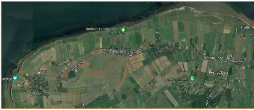
Nørholmegnens Samråds geografiske område

Bortset fra møder om cykelsti-projektet i Restrup Enge i 2021, er det desværre ikke så meget vi hører til disse områder. Enkelte har deltaget i samrådsmøderne, og det har være dejligt, men vi ser gerne at vi får etableret et egentligt samarbejde, så vi kan leve op til Samrådets intentioner.