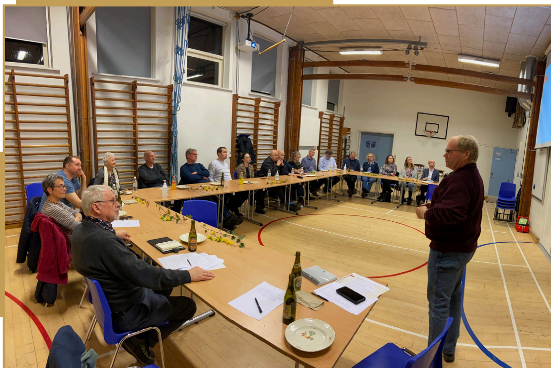
Billedet er fra et tidligere samrådsmøde

Mødet slutter med en runde, hvor foreningsrepræsentanterne har mulighed for at orientere om deres aktuelle og kommende aktiviteter.