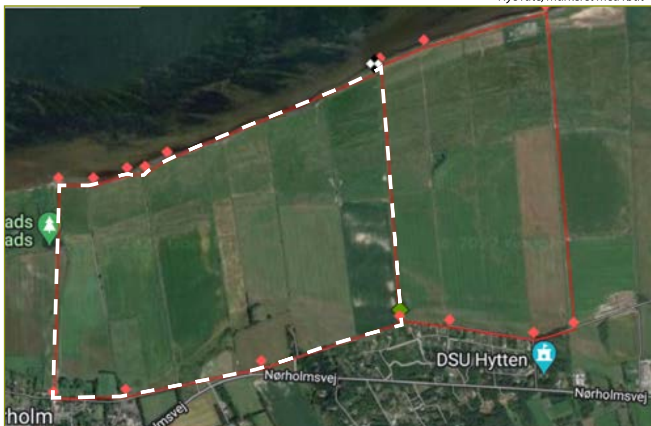
Nye rute, markeret med rødt

De øvrige stier nær Nørholm kan ses på billedet herover. Alle med udgangspunkt ved Hølstien / Hanedamsvej, hvor der også er en folder med en beskrivelse af stierne. Du kan læse om stierne her www.sti.noerholmby.dk