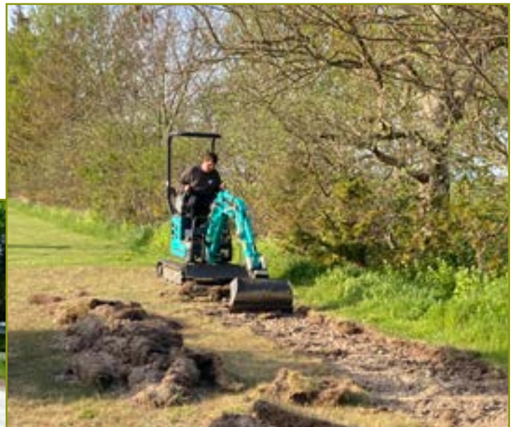
Frivillige jævner underlaget og lægger stenmel ud på den "nye" petanque bane.