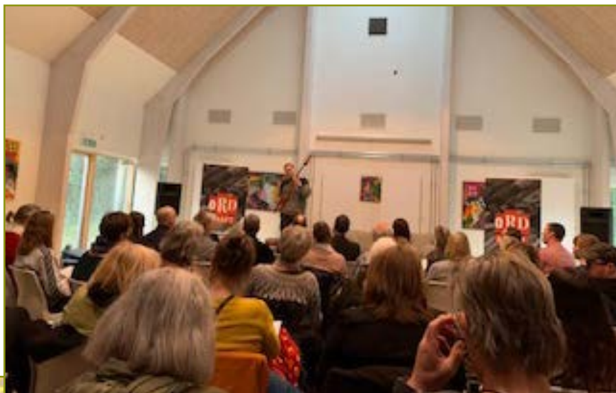
Fra Ordkraft arrangementet i marts 2022

tænk sig at bo i en ganske lille landsby, hvor alle disse helt fantastiske kulturoplevelser er en mulighed. Det kalder på anerkendelse til alle aktive, men i høj grad også til alle jer, der bakker op og deltager.