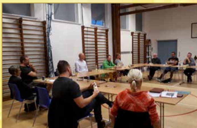
Billedet er fra et tidligere samrådsmøde

Skriv en mail med oplysning om navn og adresse på deltagerne til noerholmborgerforening@gmail.dk