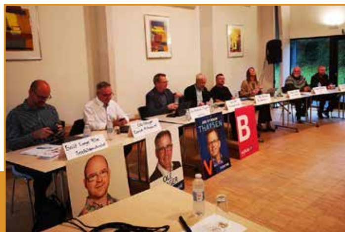
Det politiske panel

Emnerne, der blev debatteret på mødet, var udelukkende emner vedrørende forholdene i kommunens landdistrikt.