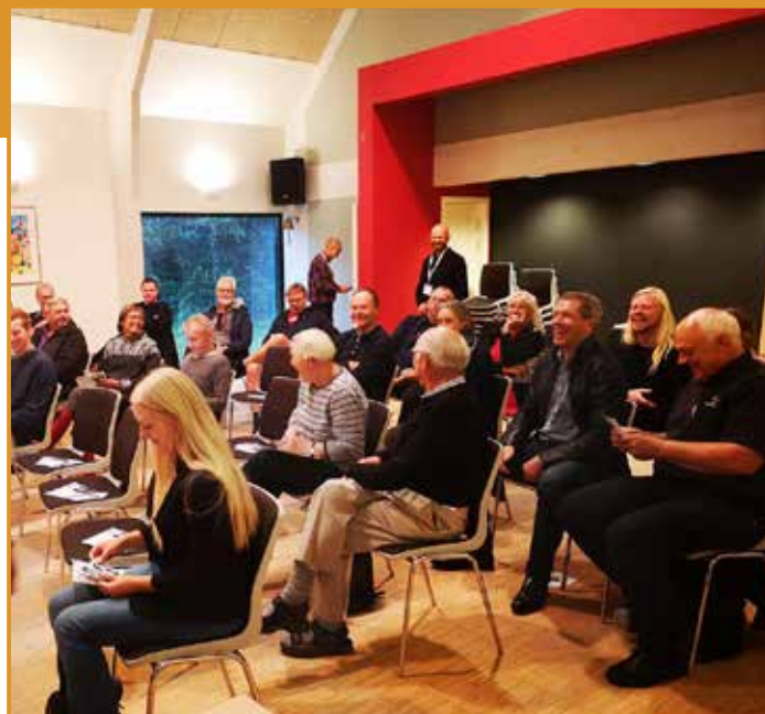
Der var også plads til morsomheder

LAK, der arbejder meget organisatorisk for at fremme forholdene i landdistriktet, ved af erfaring at jo flere gange politikerne hører om nogle konkrete emner, jo større chance er der, for at de også bliver til noget.