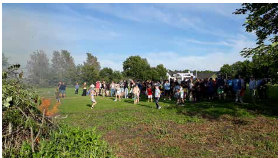
Bål og Midsommersangen