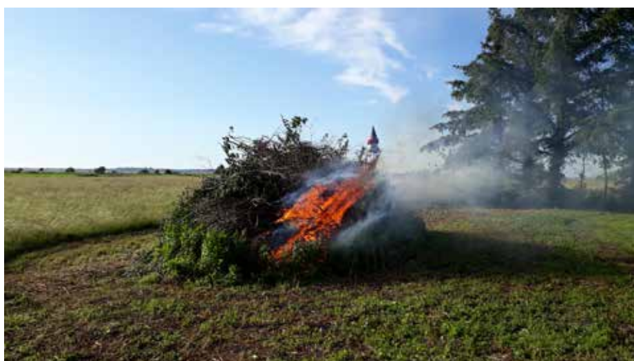
Et rigtig flot bål i en perfekt kulisse