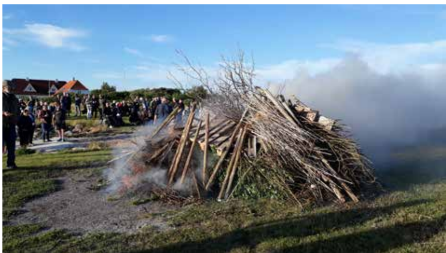
Bålet i Klitgård var anlagt ved slæbestedet.