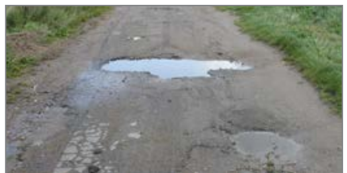
Cykelrute 12 med store huller. Nørholm Villavej