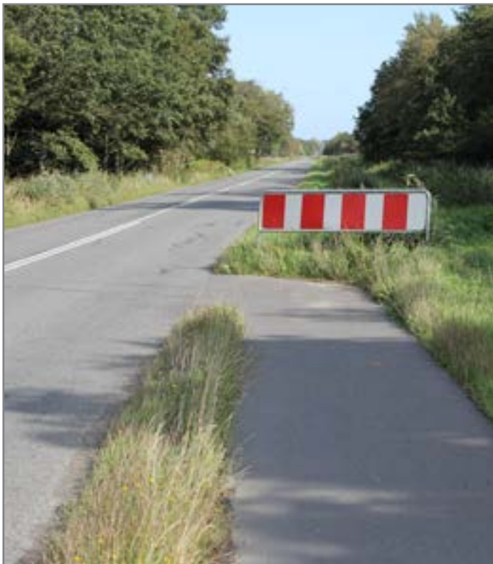
Hvad med trafikikkerheden herfra?

Dette faktum kan vi selvfølgelig vælge at acceptere og så stille os tilfredse med, at netop Nørholmsvej er den eneste større vej ud af Aalborg By, som ikke har en cykelsti fra byskiltet og ud til nærmeste landsbyer. Vi kan også vælge at gå mere aktivt ind i at få etableret en cykelsti, selvfølgelig på en positiv og konstruktiv måde.