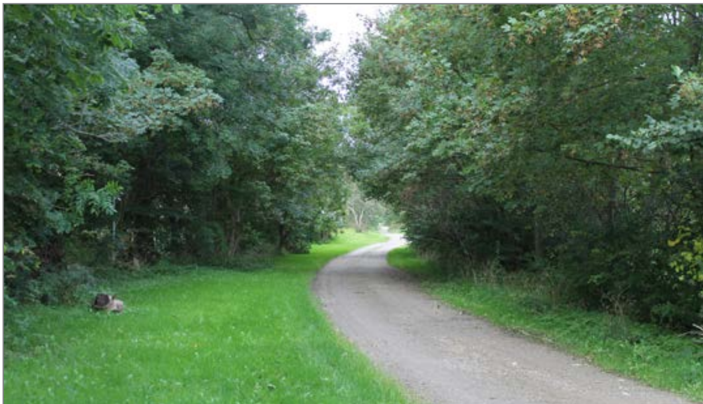
Hanedamsvej med træer, der smukt lukker sig om vejen

Arrangementet finder sted d. 24. oktober kl. 16.00 – 18.00. Vi starter ved fattighuset